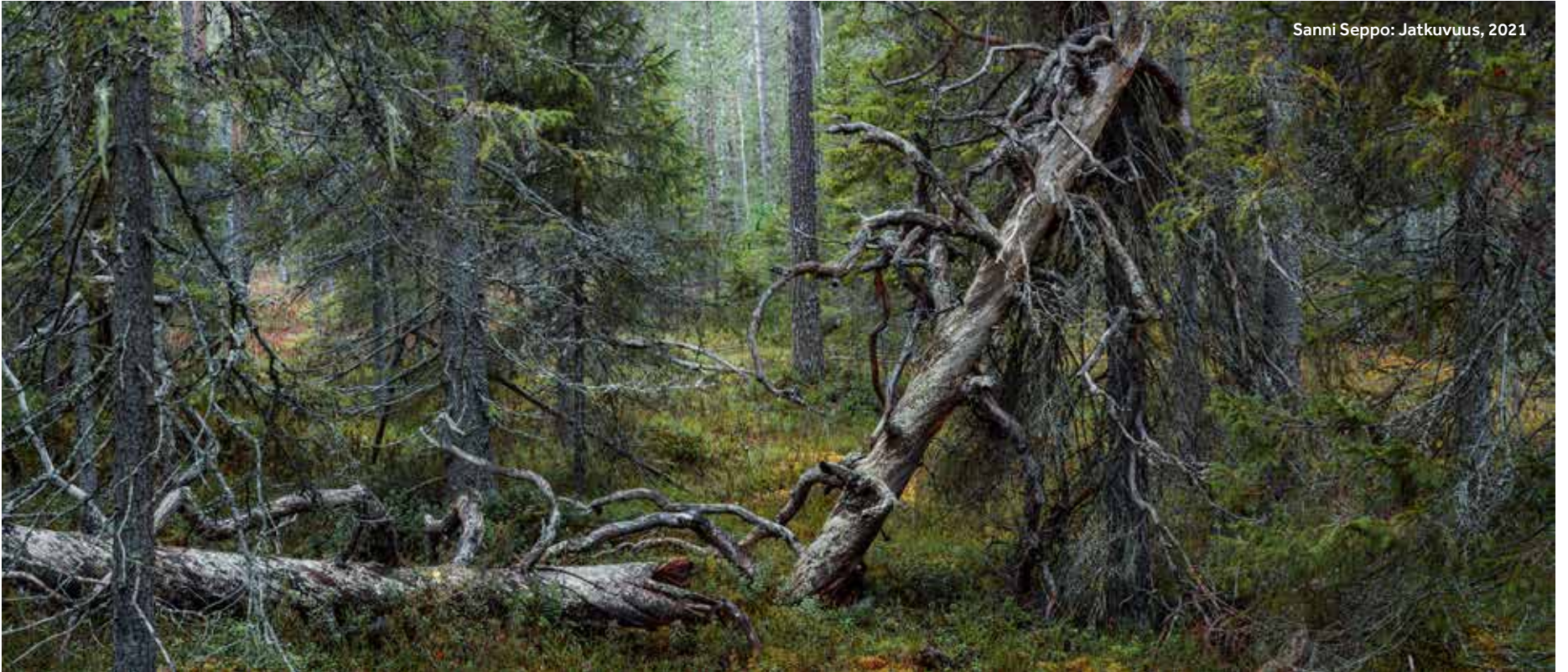
Sanni Seppo: Jatkuvuus, 2021