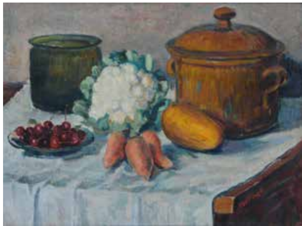
Alfred Finch: Asetelma, 1910-20-luku, öljy kankaalle, Wiipuri-museon kokoelma.

Pysyvä näyttely. Näyttely esittelee suomalaisen ratsuväen vaihteita aina 1500-luvulta tähän päivään saakka.