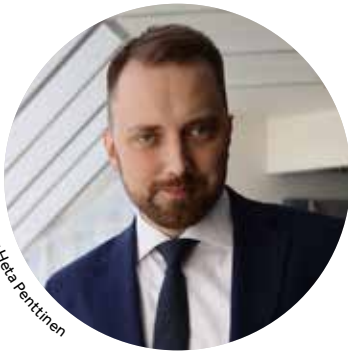
Kuva: Heta Penttinen